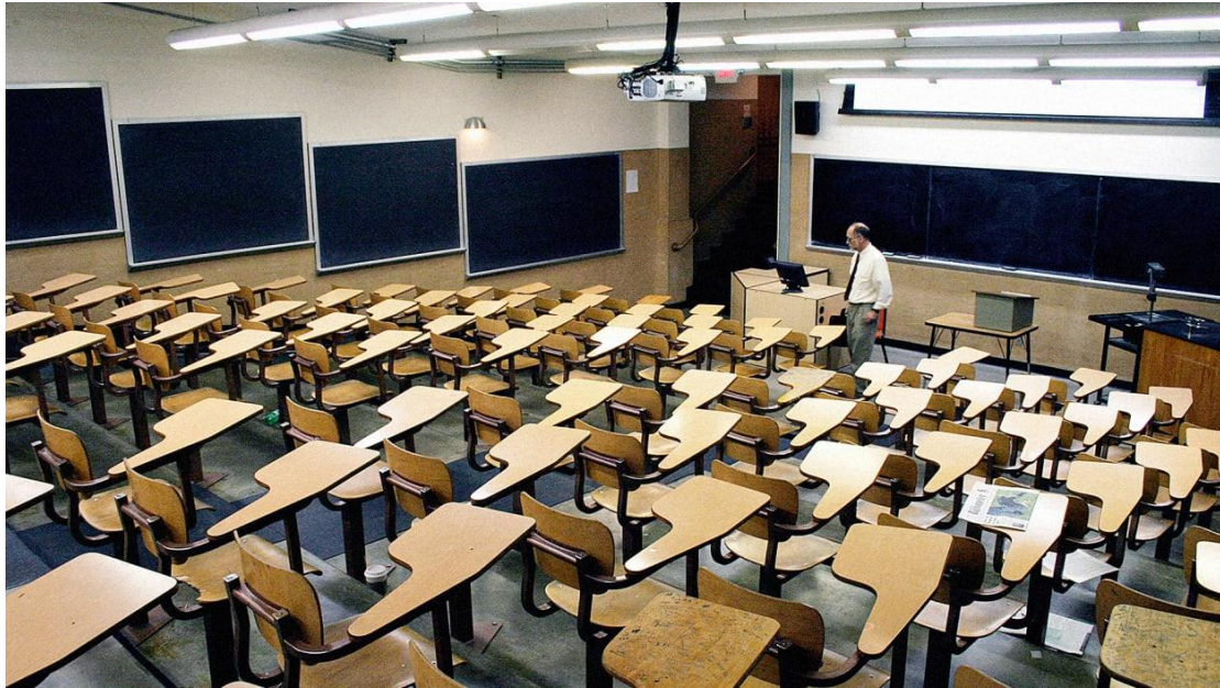
Εικόνα χ. Πανεπιστημιακή αίθουσα διδασκαλίας σε αμερικανικό πανεπιστήμιο

την εικόνα, όπως φαίνεται στο ακόλουθο παράδειγμα.