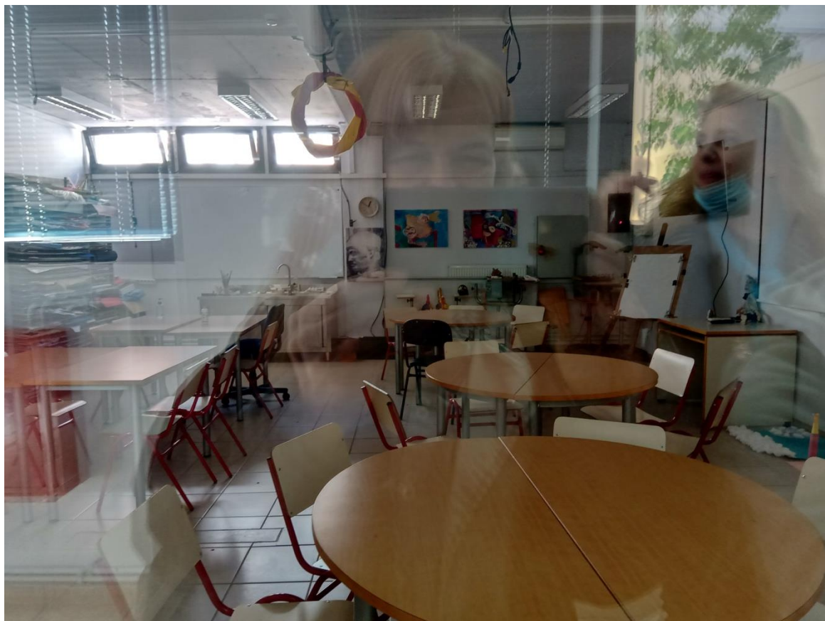
7. Η εντυπωσιακή αίθουσα των Εικαστικών Δραστηριοτήτων του τμήματος.