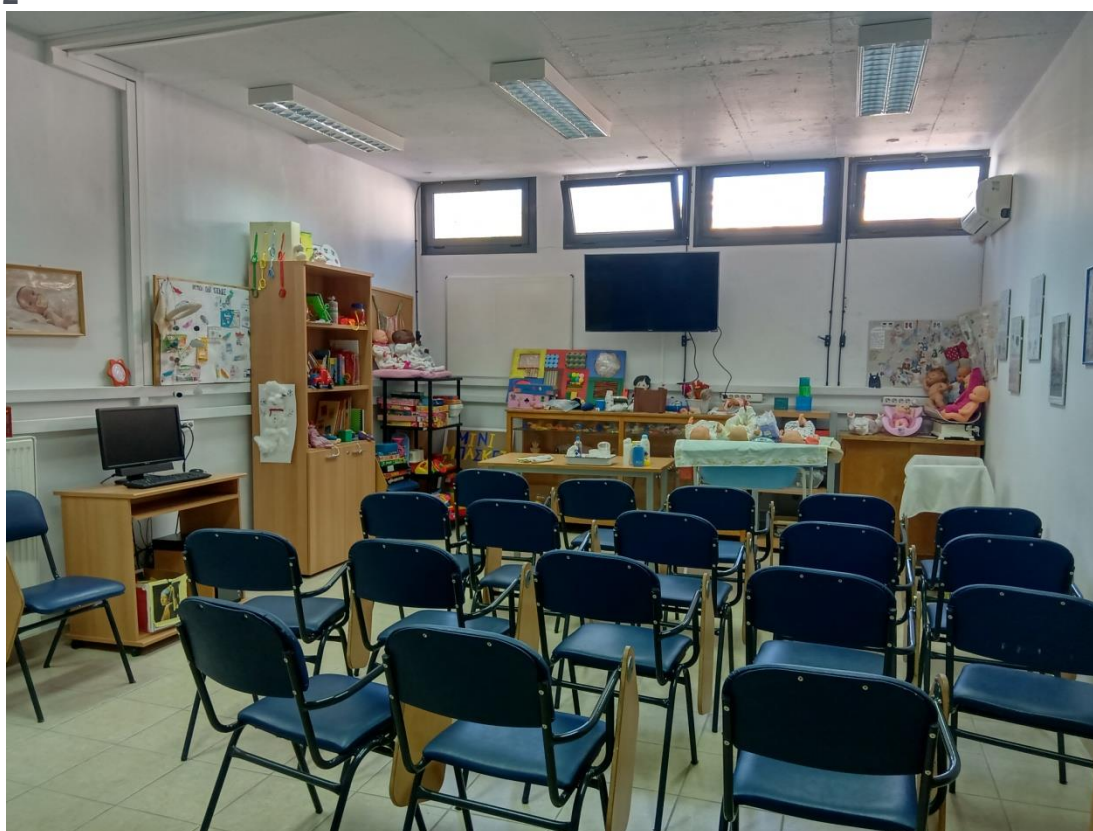
3 Η αίθουσα φροντίδας Βρεφών.